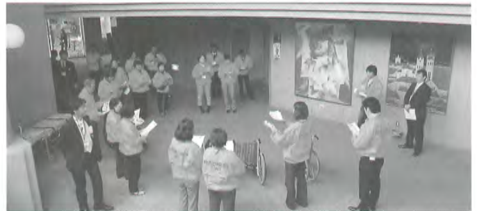
ボランティアの皆さんご苦労様でした