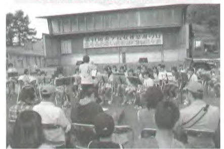
北斗ふれあい広場2012in美ヶ丘