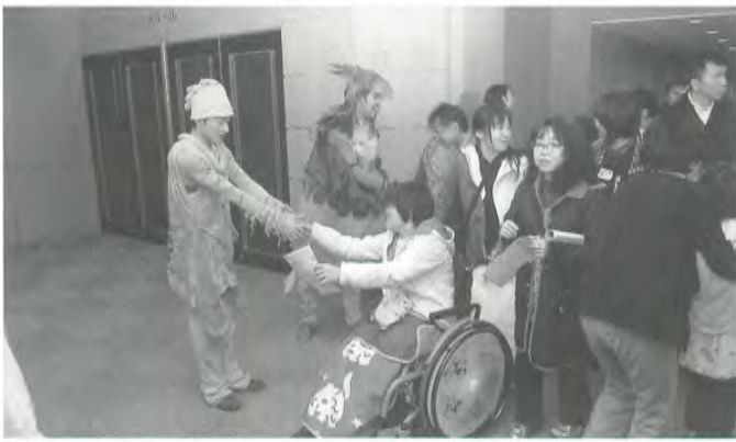
▼公演終了後に出演者が出てきてくれました▲

かなでくる会場は4年ぶり、北斗市をはじめ近隣の施設や学校の方々約700名が招待され楽しいひと時を過ごしました。