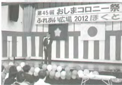
ふれあい広場2012「ほくと」