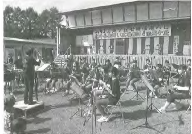
美ヶ丘収穫感謝の日の様子