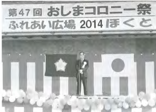
おしまコロニー祭の様子