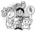
募金活動のお手伝い

「ふれあい福祉まつりin北斗」で、お手伝いをしてくれる方を募集しています。さまざまな福祉や活動にふれ、楽しみながらボランティア活動をしてみませんか？