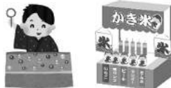
縁日コーナーのお手伝い