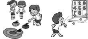
遊び場のお手伝い