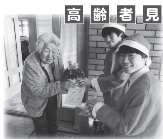
高齢者見守り活動