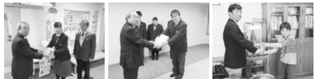
上磯高等学校 様 北斗高等支援学校 様 谷川小学校 様