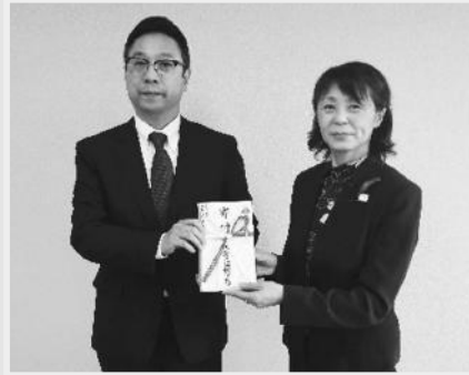
株式会社函館なとり