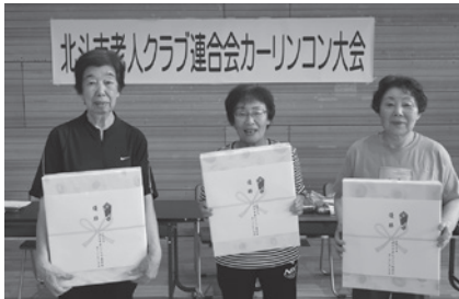
優勝 クラブひまわり