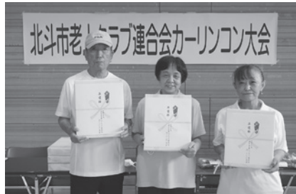
準優勝 むくげザロン