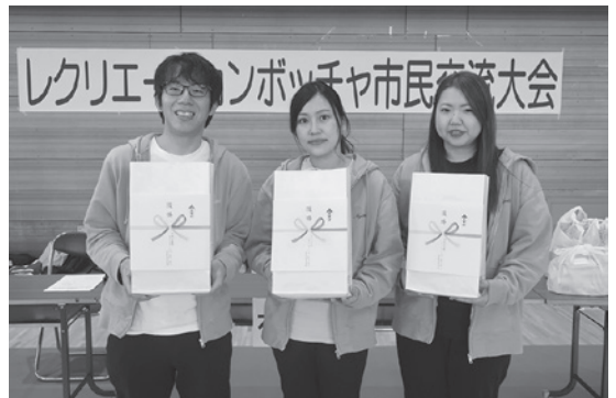
令和5年度第2回優勝チーム ねじ込み