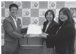
渡島地区郵便局長婦人会 様

社会福祉協議会にご寄附いただいたタオル等は、高齢者施設や保育所等で使っていただいております。本当にありがとうございました。