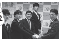
上磯高等支援学校 様