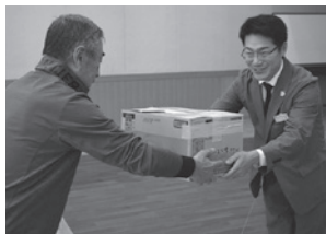
きらめき大学 学生会 様