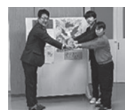
茂辺地小中学校 様

この募金の7割が北斗市の福祉活動に役立てられ、残りの3割が北海道内の福祉のために活用されています。また、歳末たすけあい募金は、現在1,401,160円の募金が集まっております。この募金は、歳末福祉見舞金、ふれあい・見守り活動事業、サンタクロース活動事業等に使われています。赤い羽根共同募金・歳末たすけあい募金は、市民の皆さまの温かいお気持ちに支えられている募金です。ご協力ありがとうございます。